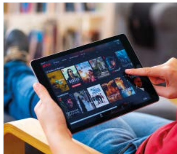
Je regarde des vidéos.