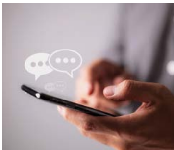
J'envoie des messages.