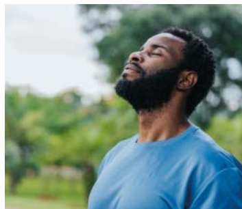
Je me déconnecte.