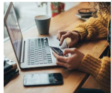
Je fais des achats sur Internet.