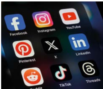
Je vais sur les réseaux sociaux.