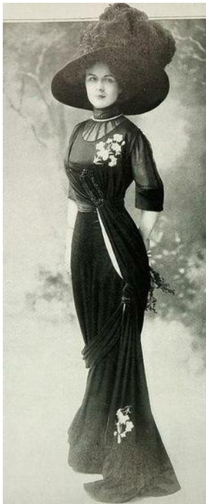
La Belle Époque (1900)

« Elle défile pour les couturiers et le reste du temps croque des silhouettes qu'un journal de mode lui achète »