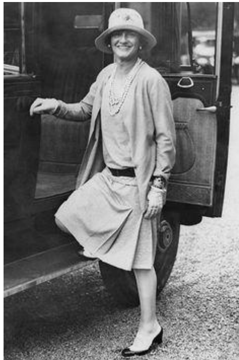
Les Années Folles (1920)