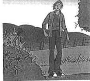
Le printemps à Gand