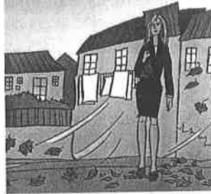
L'automne à Lisbonne