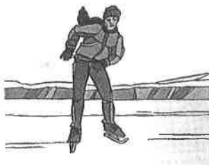
L'hiver à Anvers