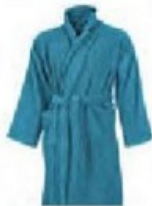
une robe de chambre