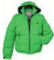
un blouson court