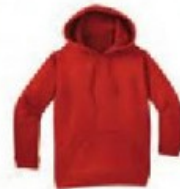
un pull-over à capuche