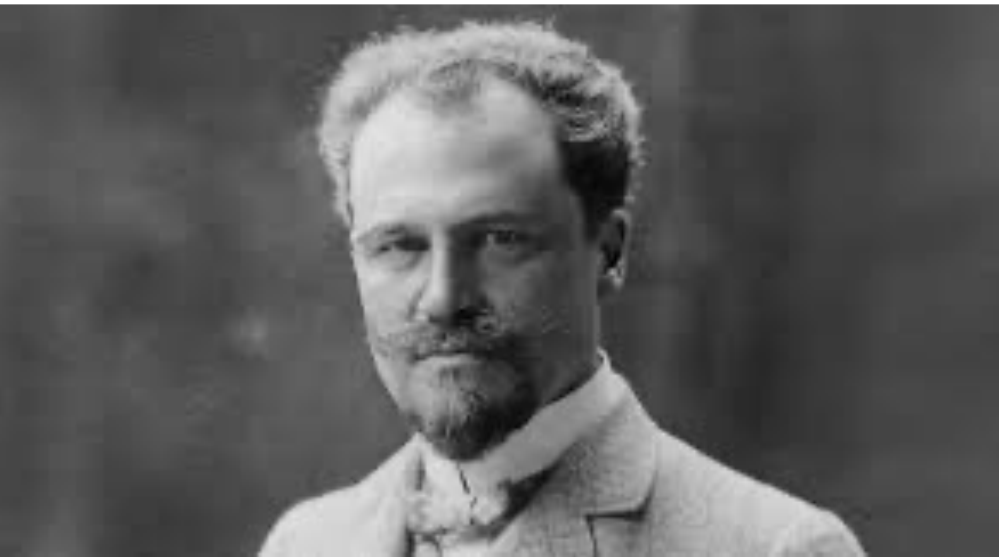
Hade en konstsamling – samlade på konst Rik —> fattig