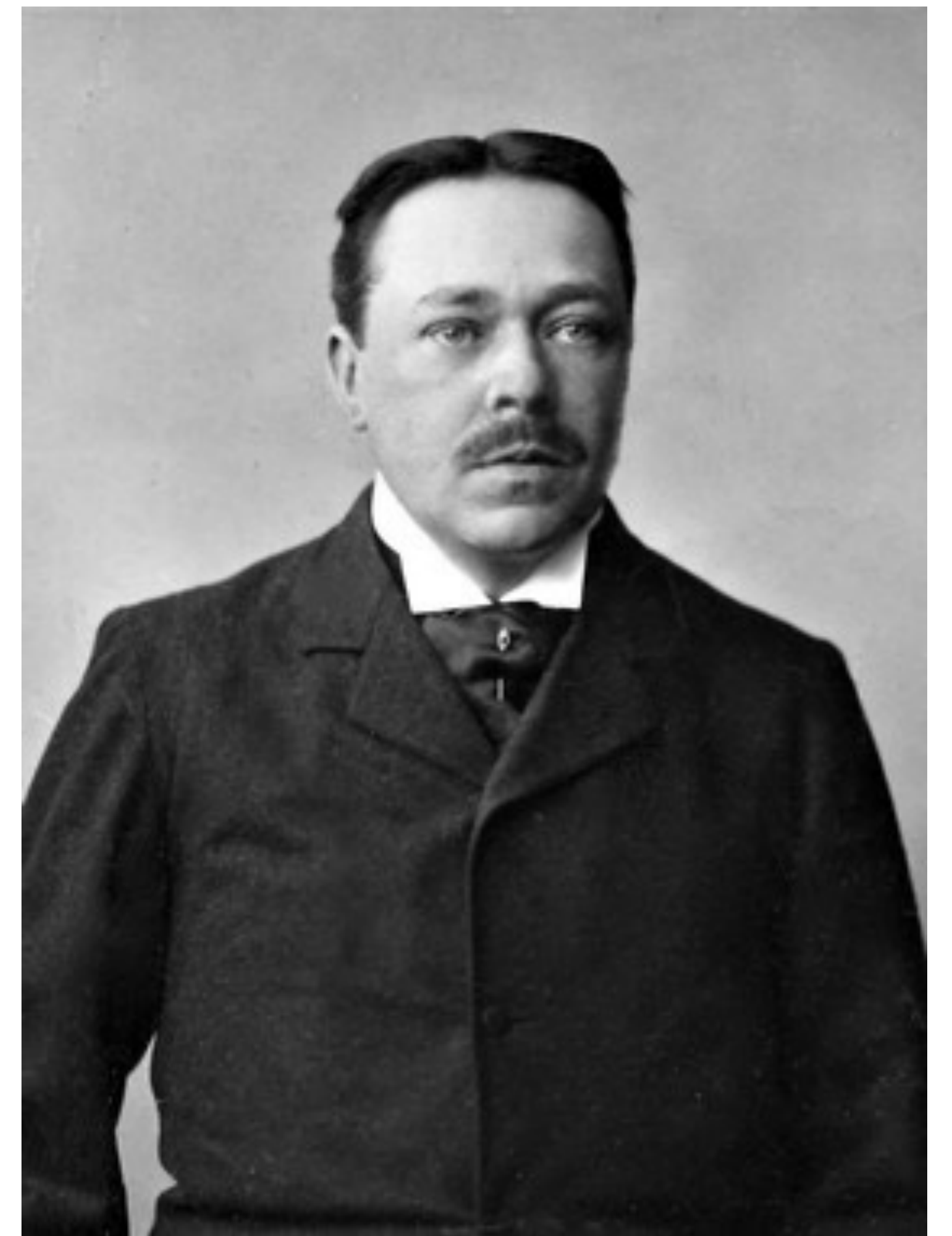
"Doktor Glas" Schack Mentalsjukhus