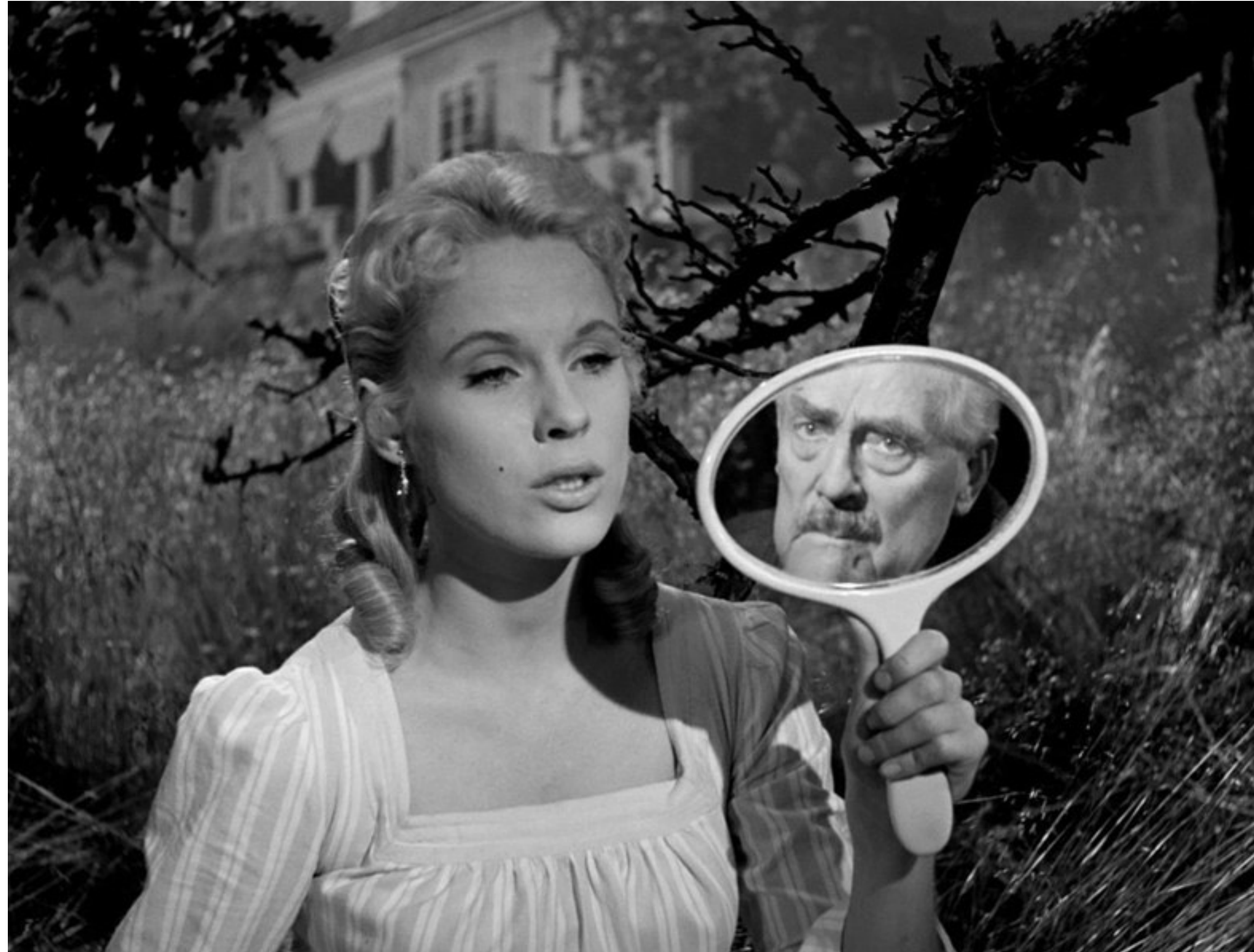
Smultronstället (1957), Ingmar Bergman