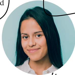
Kim "är glad"